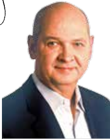
Jan Marijnissen voorzitter